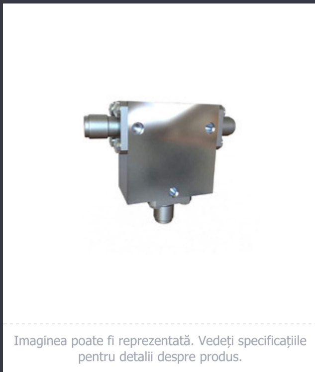
Imaginea poate fi reprezentată. Vedeți specificațiile pentru detalii despre produs.