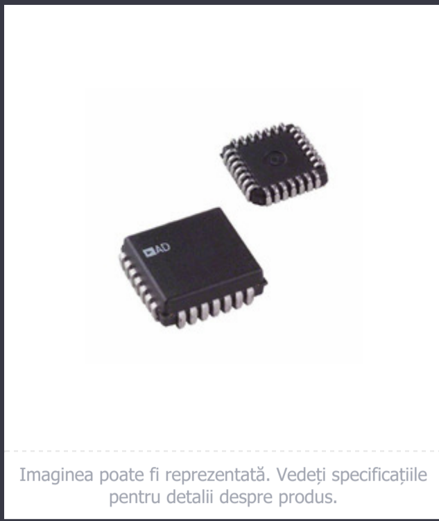
Imagina poate fi reprezentată. Vedeți specificațiile pentru detalii despre produs.