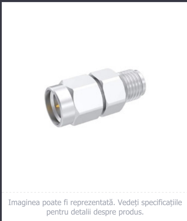
Imaginea poate fi reprezentată. Vedeți specificațiile pentru detalii despre produs.