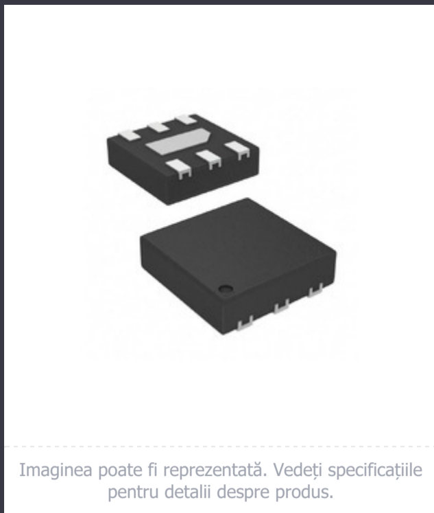
Imaginea poate fi reprezentată. Vedeți specificațiile pentru detalii despre produs.