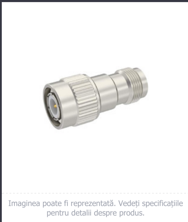
Imaginea poate fi reprezentată. Vedeți specificațiile pentru detalii despre produs.