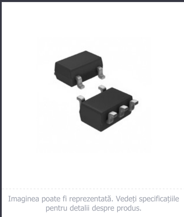
Imagina poate fi reprezentată. Vedeți specificațiile pentru detalii despre produs.