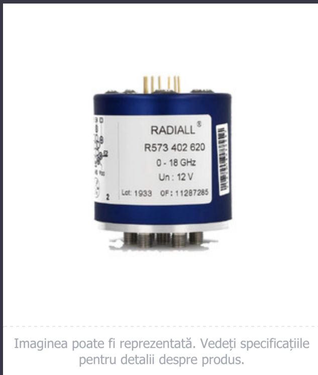
Imagina poate fi reprezentată. Vedeți specificațiile pentru detalii despre produs.