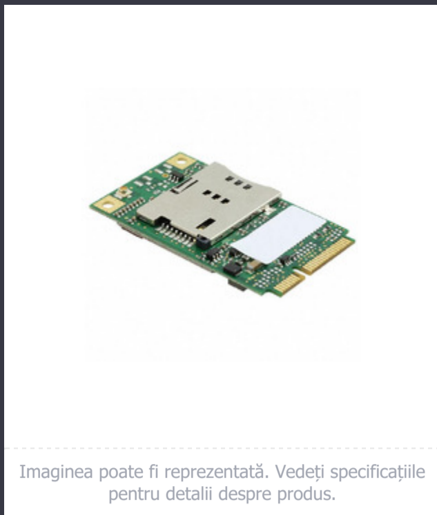
Imagina poate fi reprezentată. Vedeți specificațiile pentru detalii despre produs.