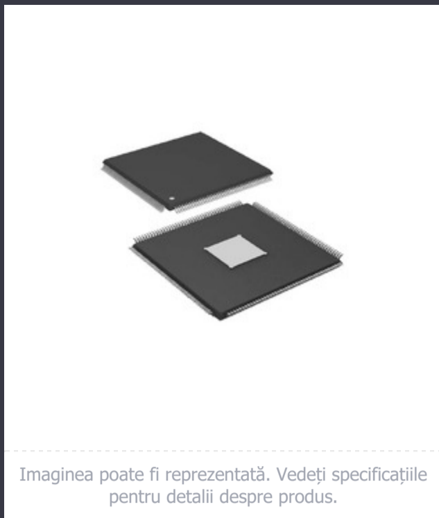
Imaginea poate fi reprezentată. Vedeți specificațiile pentru detalii despre produs.