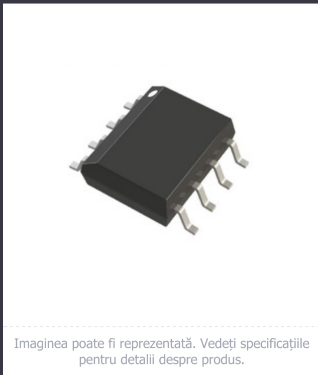
Imaginea poate fi reprezentată. Vedeți specificațiile pentru detalii despre produs.