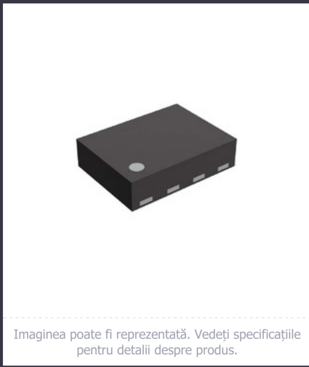
Imaginea poate fi reprezentată. Vedeți specificațiile pentru detalii despre produs.