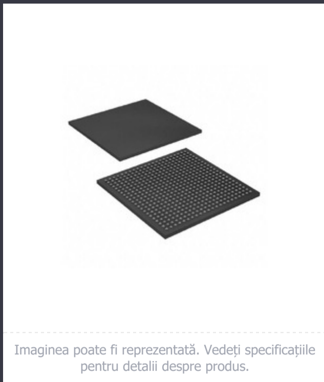
Imaginea poate fi reprezentată. Vedeți specificațiile pentru detalii despre produs.