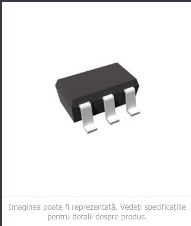
Imaginea poate fi reprezentată. Vedeți specificațiile pentru detalii despre produs.