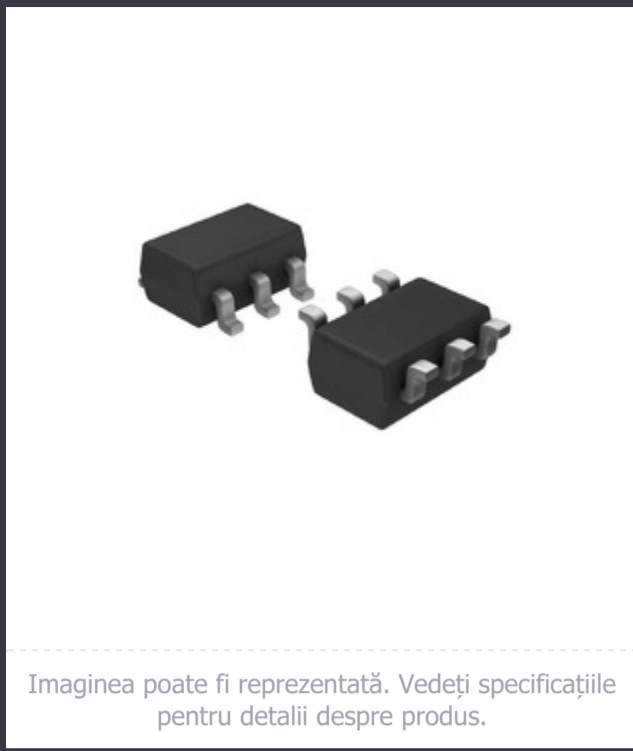
Imaginea poate fi reprezentată. Vedeți specificațiile pentru detalii despre produs.