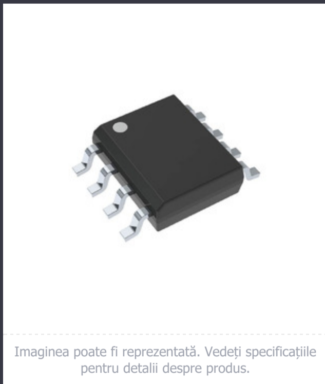
Imaginea poate fi reprezentată. Vedeți specificațiile pentru detalii despre produs.