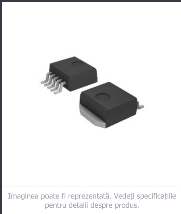
Imaginea poate fi reprezentată. Vedeți specificațiile pentru detalii despre produs.