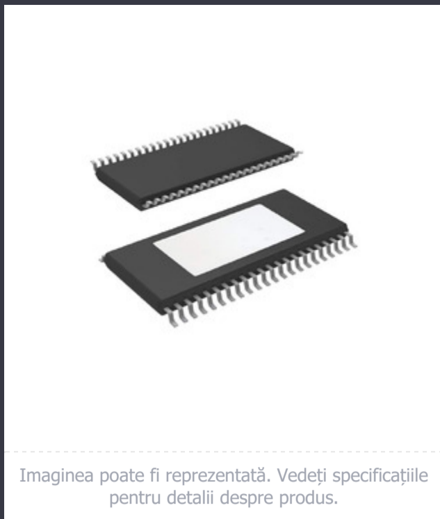
Imaginea poate fi reprezentată. Vedeți specificațiile pentru detalii despre produs.