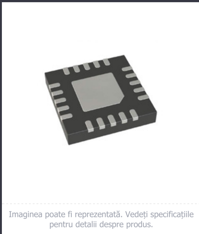
Imaginea poate fi reprezentată. Vedeți specificațiile pentru detalii despre produs.