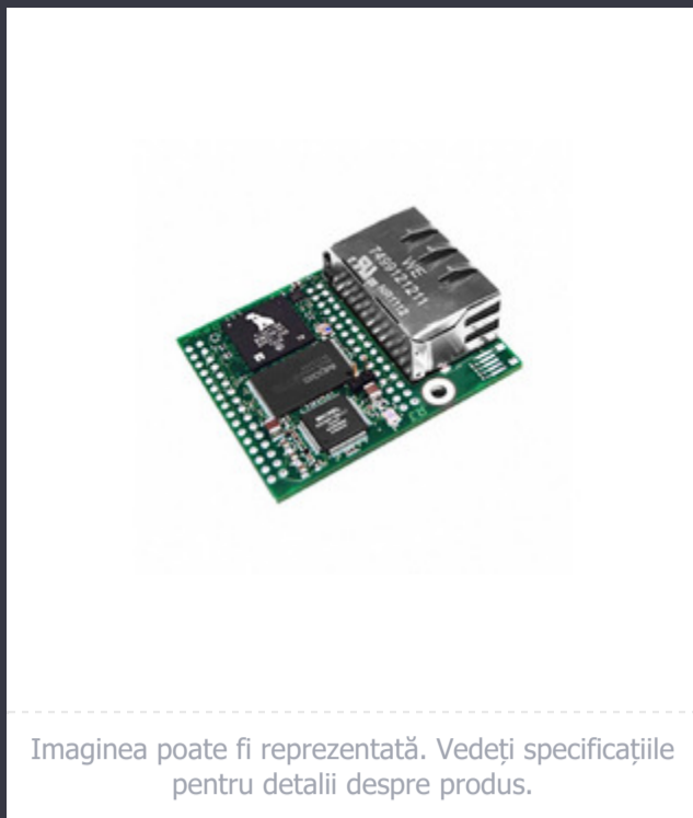
Imaginea poate fi reprezentată. Vedeți specificațiile pentru detalii despre produs.