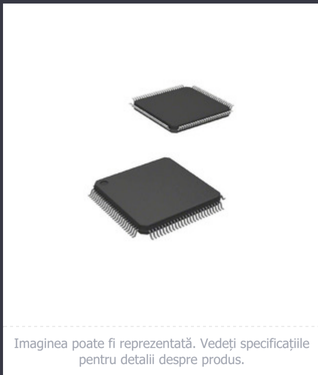
Imaginea poate fi reprezentată. Vedeți specificațiile pentru detalii despre produs.