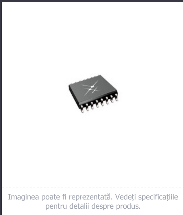
Imagina poate fi reprezentată. Vedeți specificațiile pentru detalii despre produs.