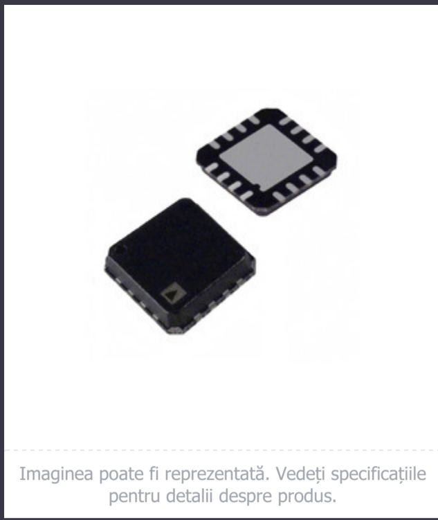
Imaginea poate fi reprezentată. Vedeți specificațiile pentru detalii despre produs.