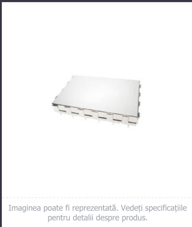
Imagina poate fi reprezentată. Vedeți specificațiile pentru detalii despre produs.