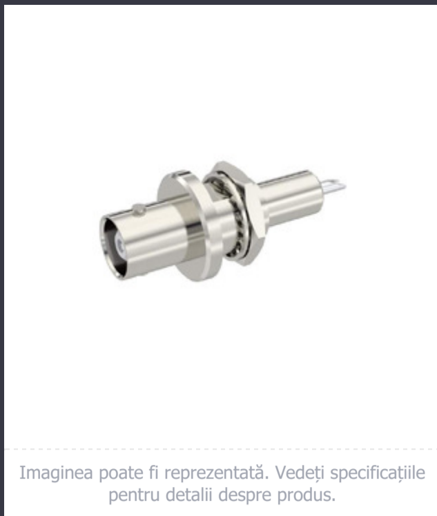
Imaginea poate fi reprezentată. Vedeți specificațiile pentru detalii despre produs.