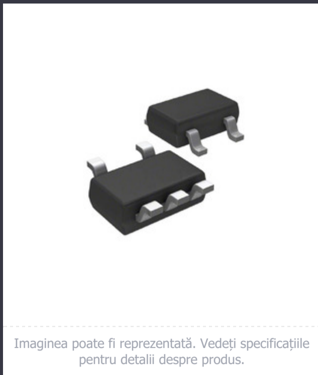
Imaginea poate fi reprezentată. Vedeți specificațiile pentru detalii despre produs.